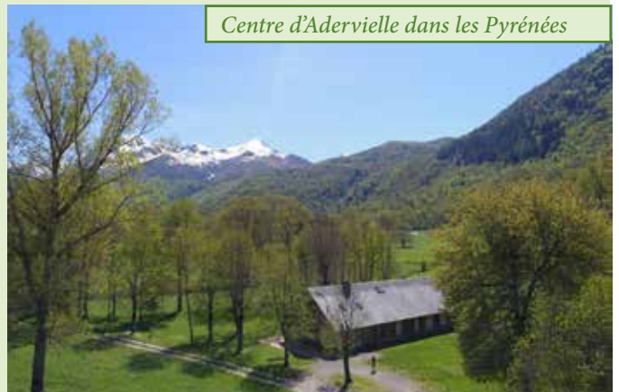
Centre d'Adervielle dans les Pyrénées