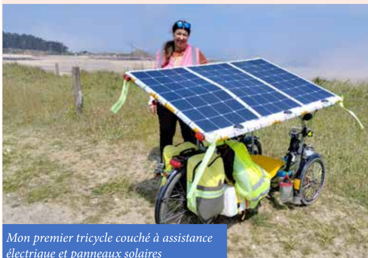
Mon premier tricycle couché à assistance électrique et panneaux solaires

Cyclo Accueil Cyclo (CAC) ( https://www.cyclo-camping.international ) : initiative de l'association Cyclo-Camping International, le CAC propose un réseau d'hébergement entre membres de l'association. Là, vous trouverez des cyclotouristes expérimentés et très accueillants, ambiance « association » oblige ! Beaucoup d'adresses en Bretagne.