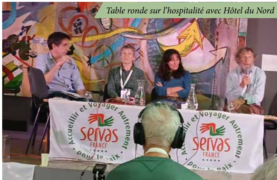
Table ronde sur l'hospitalité avec Hôtel du Nord

Le bouche-à-oreille reste de loin la principale façon de découvrir Servas, toutefois 14 % des nouveaux adhérents ont connu Servas par son site web, lors de Salons ou par les médias. De quoi poursuivre nos efforts pour faire davantage connaître notre formidable association.